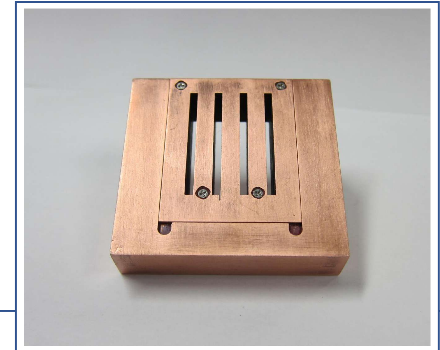
ガラスキャピラリー

レンズが接近するのでフラットな形状とし、キャピラリーまでの距離を短くするため1mm板で固定する構造とした